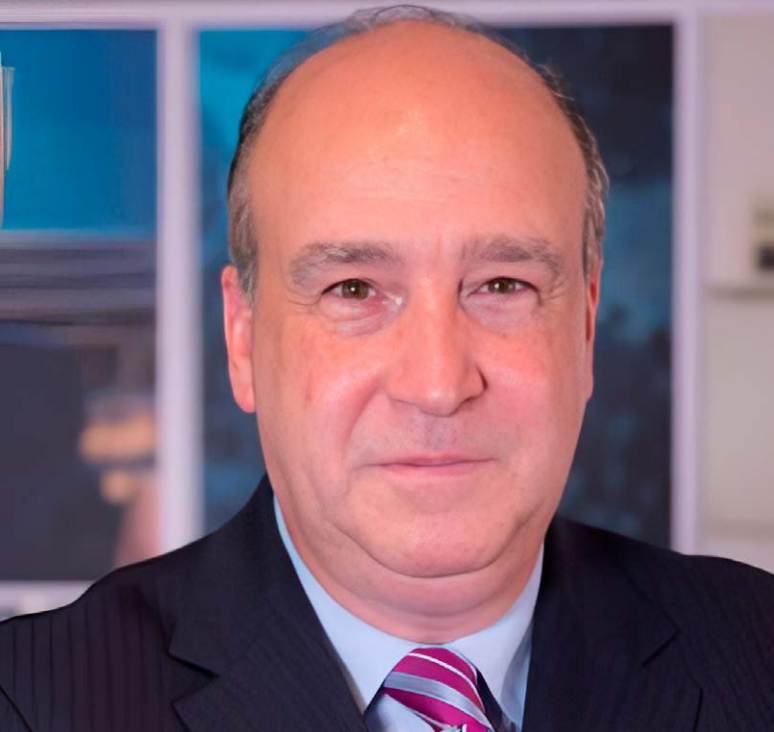
DIRECTOR DEL PROGRAMA